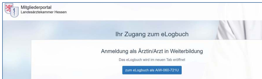
Abb. 6: Portal der LÄKH – Anmeldung am eLogbuch.

Sollten Sie von einer anderen Ärztekammer nach Hessen wechseln, verfügen Sie unter Umständen schon über ein Konto im eLogbuch. Sie erhalten dann kein „neues“ Konto, sondern verwenden weiterhin